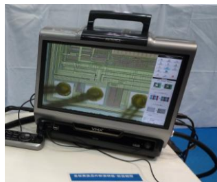
半導体のモールド樹脂 を開封し顕微鏡で 観察した結果をモニター で表示