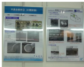
パネルによる解析、 品質信頼性評価 事例の紹介